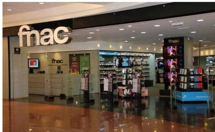
Fnac foi notificada pelo Procon e pode pagar multa de R$ 7,2 milhões Reprodução/Facebook

Após receber notificação do Procon (e ameaça de multa de R$ 7,2 milhões ), a rede de comércio varejista Fnac informou nesta terça-feira (27) que está providenciando a documentação necessária para obter a autorização e atuar como free shop na loja inaugurada no novo terminal do aeroporto de Guarulhos.